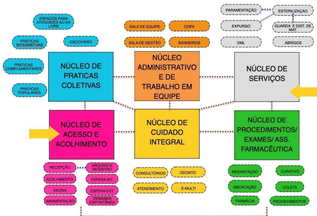
Figura 1: Diagrama de Massas